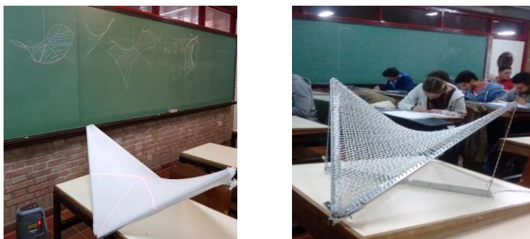
Figura 2. Paraboloide hiperbólico

conceptualización de superficie continua. Con el uso de un nivel láser se visualizan las trazas y las curvas de intersección con planos paralelos a los planos coordenados.