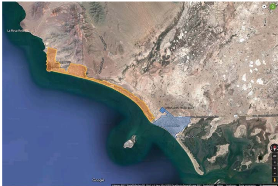
Fig. N° 2. Bahía de Kino, costa del Mar de Cortés

Bahía de Kino se asienta sobre una franja litoral de aproximadamente 18km. En la imagen se observa Kino Nuevo en naranja, Kino Viejo en azul. En el extremo norponiente se encuentra la colonia Mediterráneo, uno de los sectores con mayor cantidad de vivienda en condiciones precarias y vivienda beneficiada por programas públicos.