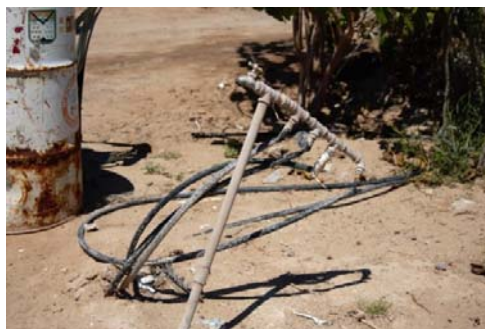
Fig. N° 5. Primeras tomas de agua potable en la Colonia Mediterráneo