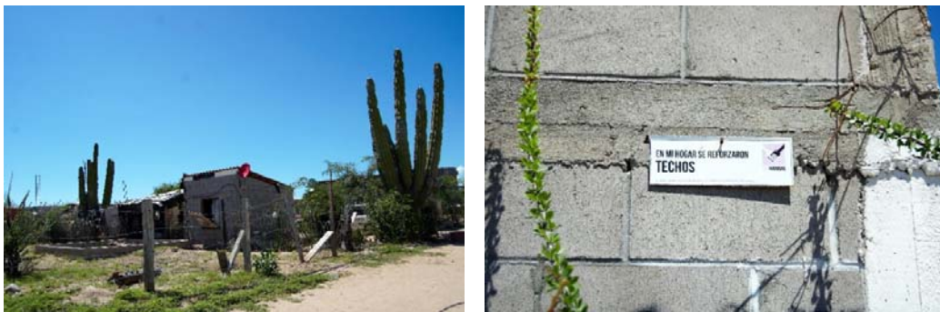
Fig. N° 7a y 7b. Cuarto construido a través del Programa para el Desarrollo de Zonas Prioritarias

Fuente: Archivo del proyecto PBH2017, fecha de captura 9 de septiembre de 2017.