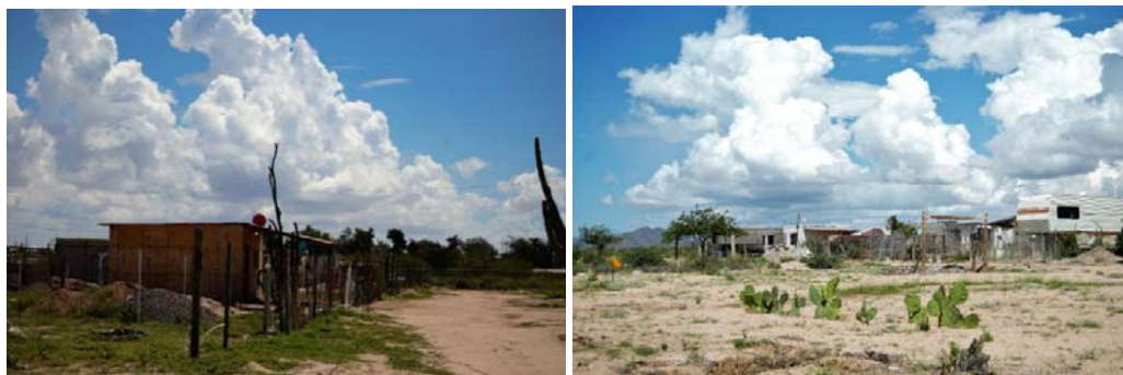
Fig. N° 3a y 3b. Viviendas de la Colonia Mediterráneo en Kino Viejo

En la imagen de la izquierda se puede apreciar el poste improvisado para soportar cables de energía eléctrica. A la derecha, la colindancia suroeste del asentamiento. Los nopales delimitan un campo de fútbol improvisado por los residentes.