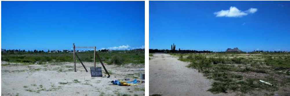
Fig. N° 6a y 6b. Entorno de la Colonia Mediterráneo en Bahía de Kino Viejo

Fuente: Archivo del proyecto PBH2017, fecha de captura 9 de septiembre de 2017.