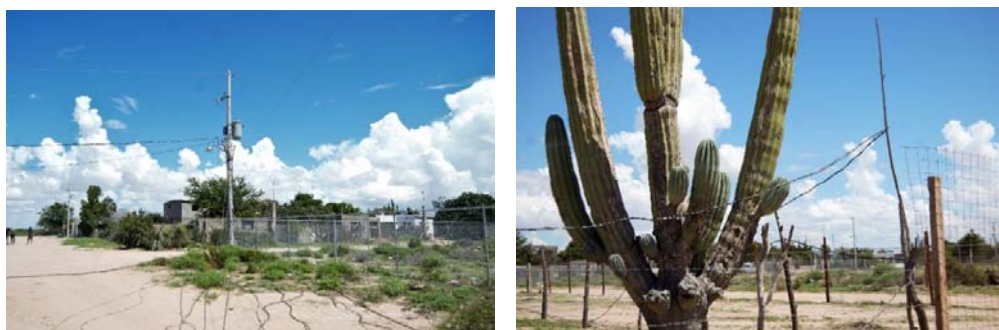
Fig. N° 4a y 4b. Suministro improvisado de energía eléctrica en la Colonia Mediterráneo

En la esquina nororiente de la Colonia Mediterráneo existen dos postes de luz. Sólo las viviendas contiguas a este suministro cuentan con un contrato, el resto de la colonia se abastece mediante cables conectados de manera irregular.