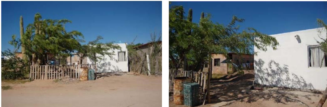
Fig. N° 8a y 8b. Cuarto rosa en Bahía de Kino Viejo

Los cuartos rosas o estrategia “Un cuarto más” de la Secretaría de Desarrollo Agrario, Territorial y Urbano (SEDATU) tienen como meta reducir las probabilidades de violencia hacia la mujer relacionado con las condiciones de hacinamiento.