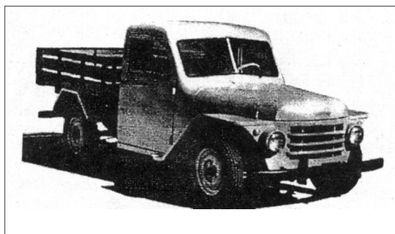
Fig. 1- Rastrojero

El IAME produjo tractores "Pampa", vehículos utilitarios "Rastrojero" -fig.1-, motocicleta "Puma" -fig.2-. Cabe notar que estos productos son importantes para la sociedad argentina de esa época y a pesar de no sobresalir por sus cualidades formales, se destacaron por sus prestaciones utilitarias, buen rendimiento y precios accesibles.