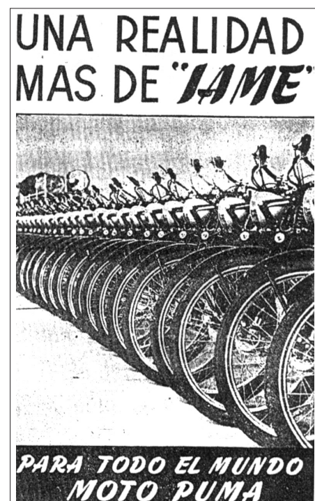
Fig. 4- Afiche

A fines de los '50, la situación en el país cambia a partir de la crisis, que provoca dificultades para importar, deterioro de las maquinarias y falta de infraestructura adecua-