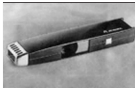
Fig. 6- Magiclick

A comienzo de los '70, otra empresa que se destaca por la incorporación del diseño es Aurora, cuyo nuevo producto Magiclick -fig.6-, se mantiene por varias décadas convirtiéndose en uno de consumo masivo. Esta empresa había comenzado su actividad dedicada a la fabricación de la línea blanca del hogar. El Magiclick, diseñado por Hugo Kogan, inicia su proceso de elaboración a fines de los '60. Durante esos años se produce el pleno auge de la electrónica. Por consiguiente, Kogan, director del Departamento de Diseño de la empresa, analiza el funcionamiento del piezoeléctrico de origen Japonés, considerado inédito. De este análisis se observa la característica de que al presionar un extremo, se