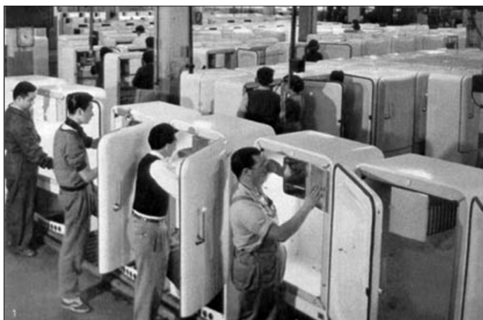
Fig. 5- Planta de producción: heladeras SIAM

A partir del desarrollo de la heladera -fig.5-, surgen una cantidad de productos que se imponen por su diseño, como cocinas, estufas, ventiladores, planchas y televisores, que aportan novedades tecnológicas y mantienen una línea racionalista. La novedad se plasma no sólo desde la estética, sino también desde su sistema de construcción y ensamblado, en el que se simplifica la cantidad de piezas y además se trabaja con materiales plásticos como aislantes térmicos. Lo interesante de esta empresa es que por primera vez en el país, productos de consumo masivo presentan diseño y amalgaman calidad estética, tecnología y funcionalidad.