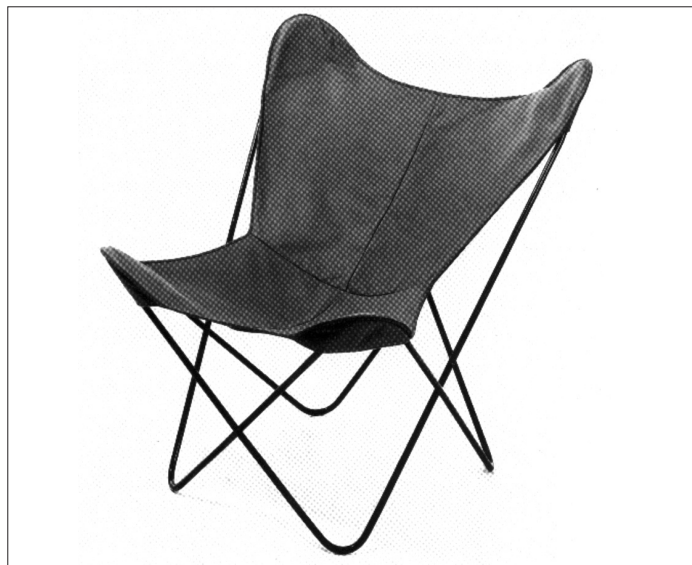
Fig. 3- sillón BKF

Un hito del diseño argentino fue el sillón BKF (Bonet, Kurchan, Ferrari) -fig.3- realizado en 1938, y que es considerado como el que marca el inicio del diseño en este país.