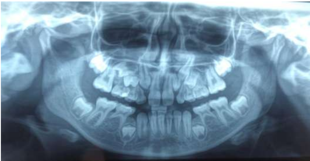
Figura 1. Radiografías panorámica, paciente femenino de 12 años de edad con agenesia dentaria no sindrómica.

A continuación se ilustra con imágenes de ortopantomografías panorámicas bimaxilares de pacientes con agenesias dentarias sindrómicas y no sindrómicas figura 1, 2 y 3).