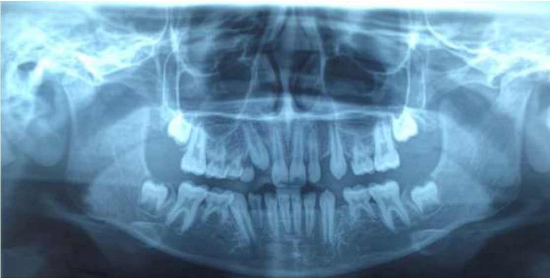
Figura 3. Radiografía panorámica, paciente femenino de 10 años de edad con agenesia dentaria asociada a Síndrome de Displasia Ectodérmica.