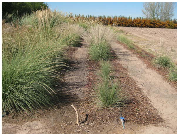
Ensayo de riego en la parcela experimental de la Cátedra de Espacios Verdes.

Las gramíneas son un grupo de plantas ornamentales rústicas que en los últimos años se comercializan por ser adecuadas a la jardinería de zonas áridas. Sin embargo, faltan datos precisos acerca de su expresión a diferentes condiciones de cultivo. Los ensayos realizados en la parcela experimental de la Cátedra de Espacios Verdes (Facultad de Ciencias Agrarias, UNCUIYO) apuntan a medir su valor estético a través de la altura de la planta, diámetro de la mata, época y duración de floración, invasividad, entre otras variables consideradas.