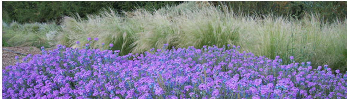
Glandularia, Stipa y Schinus como protagonistas del paisaje.

"Las ideas pueden ser y son cosmopolitas, pero no el estilo, que tiene un suelo, un cielo y un sol que le son propios" . François-René de Chateaubriand (1768-1848)