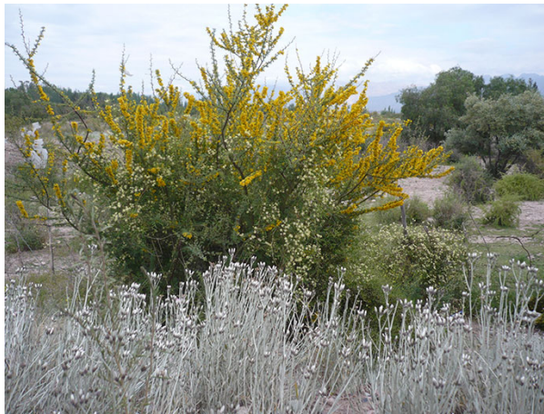
Protagonistas del paisaje: olivillo ( Hyalis argentea ) y chañar breca ( Cercidium praecox ).

Por ejemplo, para la conformación de céspedes en Mendoza la "chipica" es considerada la especie ideal por su resistencia a la sequía, a la salinidad y al ataque de plagas y enfermedades. Si bien su color invernal es denostado por muchos, su amarilleo ofrece una variación estacional que permite potenciar la composición, destacando la habilidad del diseñador.