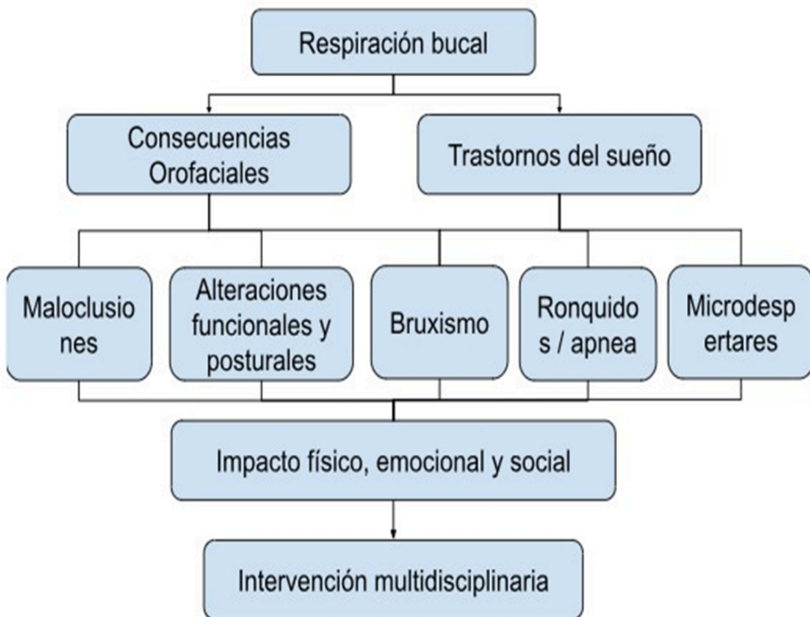
Figura 8. Esquema de flujo que ilustra las asociaciones entre la respiración bucal, las maloclusiones y las alteraciones sistémicas. Elaboración propia.

Es fundamental un diagnóstico temprano y una intervención multidisciplinaria para abordar la respiración bucal y mitigar el desarrollo y la progresión de estas maloclusiones, promoviendo así un desarrollo orofacial armónico y una