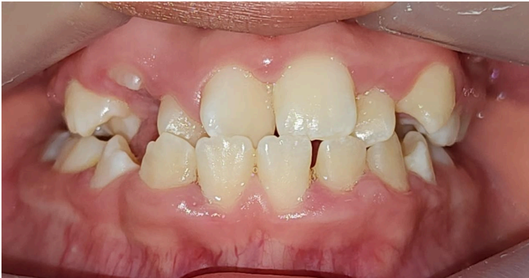
Figura 5: Mordida cruzada posterior. Imágenes de la práctica clínica.