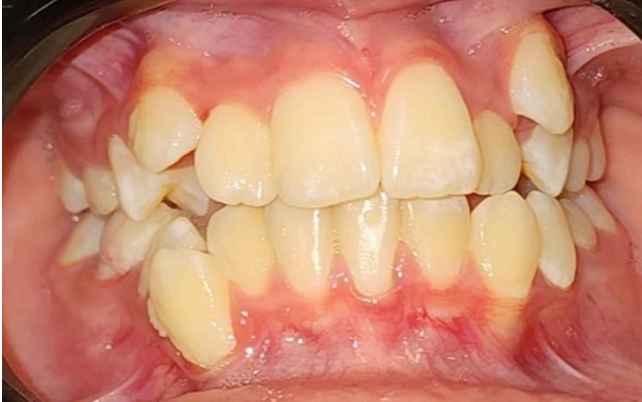
Figura 6. Apiñamiento dental a causa de atresia maxilar. Imágenes de la práctica clínica.