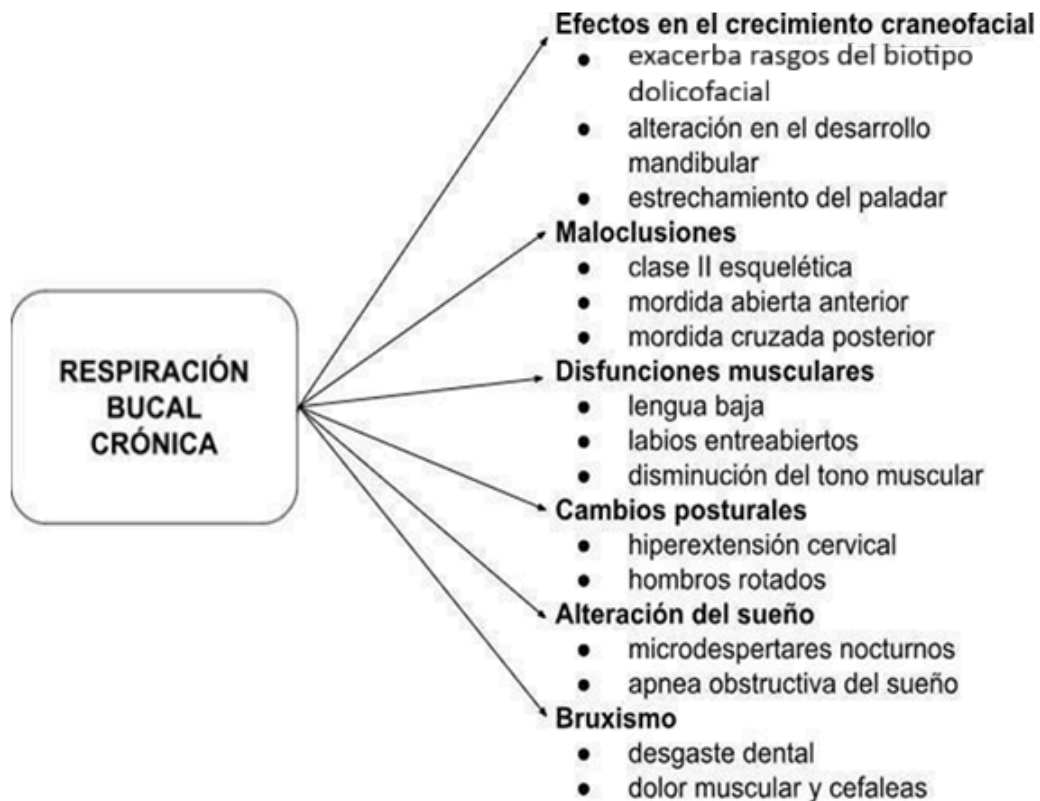
Figura 9. Principales alteraciones asociadas al hábito de respiración bucal crónica durante la infancia y adolescencia.

Por último, la consistencia de esta trayectoria lleva a explorar la fuerza de la evidencia actual, dando respuesta al quinto objetivo [10,12,14,15,23]. El análisis revela una sólida asociación entre la RB y los fenotipos oclusales, reforzada por la coherencia biomecánica y el gradiente de severidad como se observa en la síntesis de la Tabla 2. A su vez, para complementar la información de la Tabla 2, la figura 8 muestra las principales alteraciones asociadas al hábito de respiración bucal crónica durante la infancia y adolescencia.