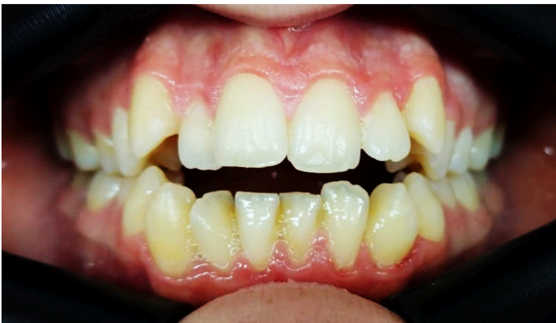
Figura 4: Mordida abierta anterior. Imágenes de la práctica clínica.

La mordida abierta anterior puede interferir en funciones orales como la masticación, la deglución y la fonación, además de impactar negativamente en la estética facial y, en algunos casos, en la postura general y el equilibrio de las estructuras óseas del cráneo [23].