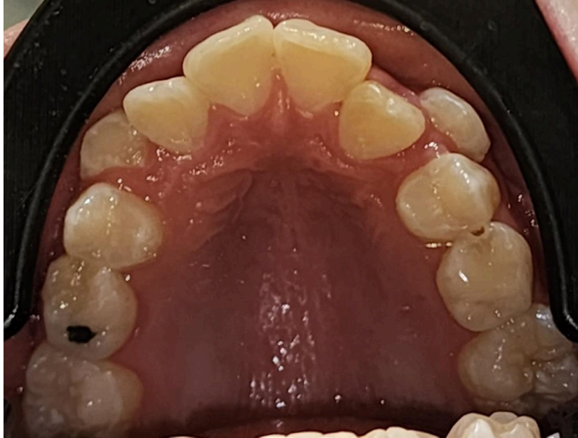
Figura 7. Paladar ojival. Imágenes de la práctica clínica.