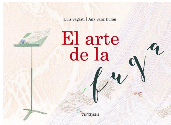
Figura 1: Tapa de El arte de la fuga

El arte de la fuga es un libro ilustrado por la artista plástica española Ana Sanz Durán. La propuesta del texto visual se prefigura en la ilustración de la tapa: un fondo construido con trazos tenues (especies de bucles) y delgadísimas líneas que podrían recordar las de un pentagrama, solo que en lugar de rectas son levemente curvas, lo que sugiere un movimiento ascendente. En el lado izquierdo se encuentra un atril que contiene una partitura cuyas hojas se han volado y aparecen desparramadas en la parte inferior de la página ascendiendo sobre las líneas del fondo, como arrastradas por una brisa. Asomando en el atril y entrelazadas con las hojas en vuelo pueden verse unas figuras diminutas y extrañas que serán luego reconocidas por el lector como las protagonistas de la historia.