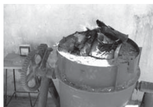
Figura n° 4 Horno experimental

Las comparaciones entre las probetas dieron como resultado que las temperaturas alcanzadas en las cocciones experimentales fueron inferiores a 780 °C ya que, en algunos casos, las piezas se desgranaban estando casi crudas o poco sinterizadas. Pero, como los datos obtenidos por las termocuplas son tan bajos, se presentó la necesidad de cocinar probetas en horno eléctrico, a temperaturas menores que 780 °C, para poder obtener datos más confiables.