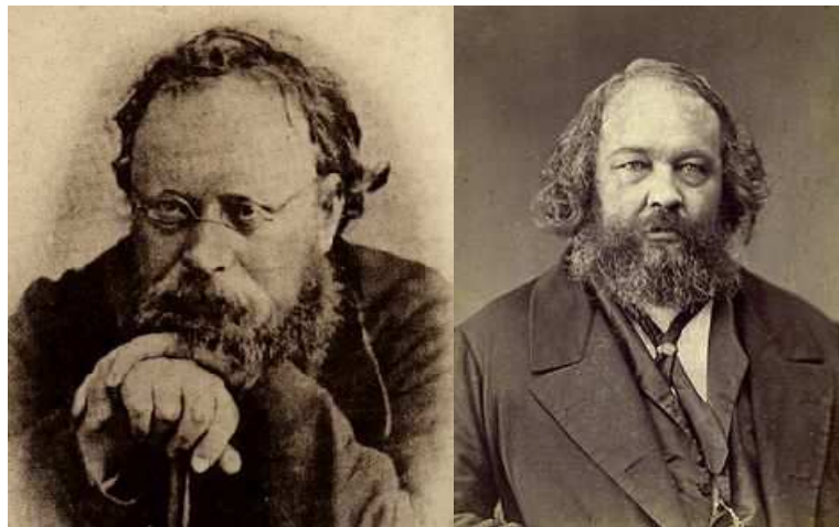
Pierre Joseph Proudhon