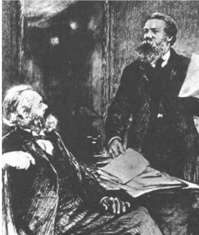
Carlos Marx y Federico Engels

“Las ideas socialistas de Marx y Engels en comparación con el socialismo no marxista”