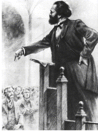
Marx en la Internacional

“Las ideas socialistas de Marx y Engels en comparación con el socialismo no marxista”