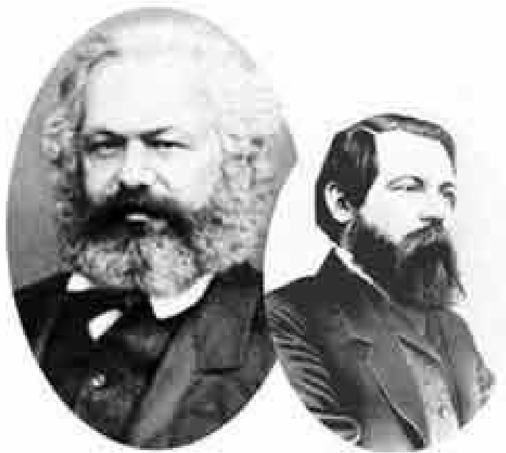
Carlos Marx y Federico Engels

“Las ideas socialistas de Marx y Engels en comparación con el socialismo no marxista”