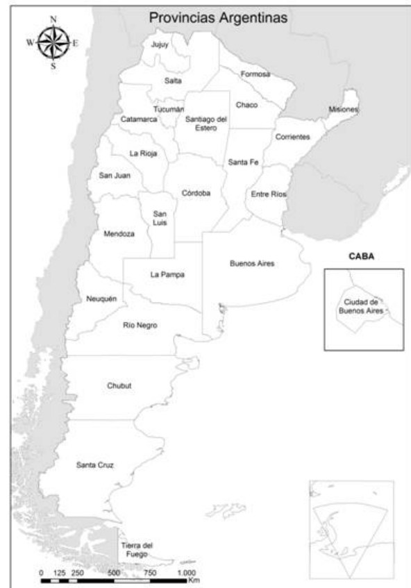
Figura 1. República Argentina, según división político-territorial (provincias).